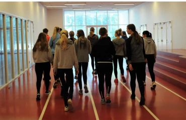
Efter chokoladebollerne var det tid til at gå udendørs, hvor dagens idrætstime skulle afholdes.