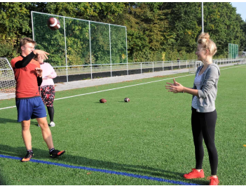
Til dagens idrætstime blev de amerikanske fodbolde fundet frem.