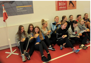
Der var glæde at spore hos eleverne over fødselsdagsfejringen.